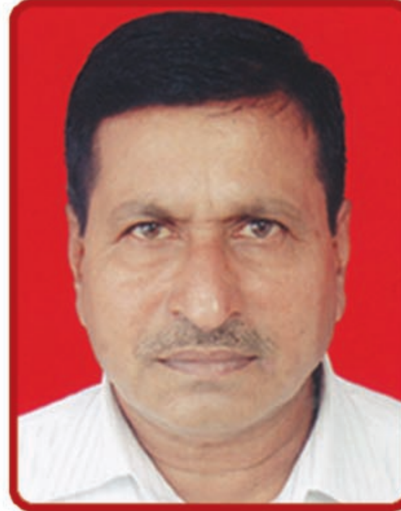
निवृत्ती सि. मस्के संचालक